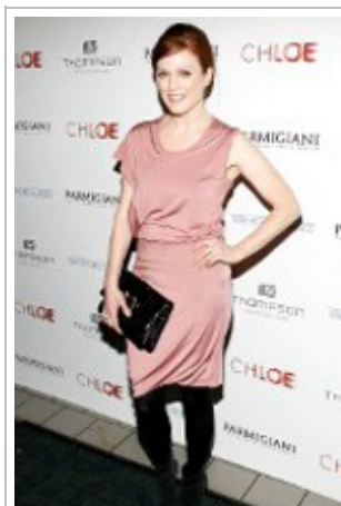
Julianne Moore de Calvin Klein Collection.

La actriz ha lucido un vestido asimétrico rosa para la presentación de su última película Chloe .